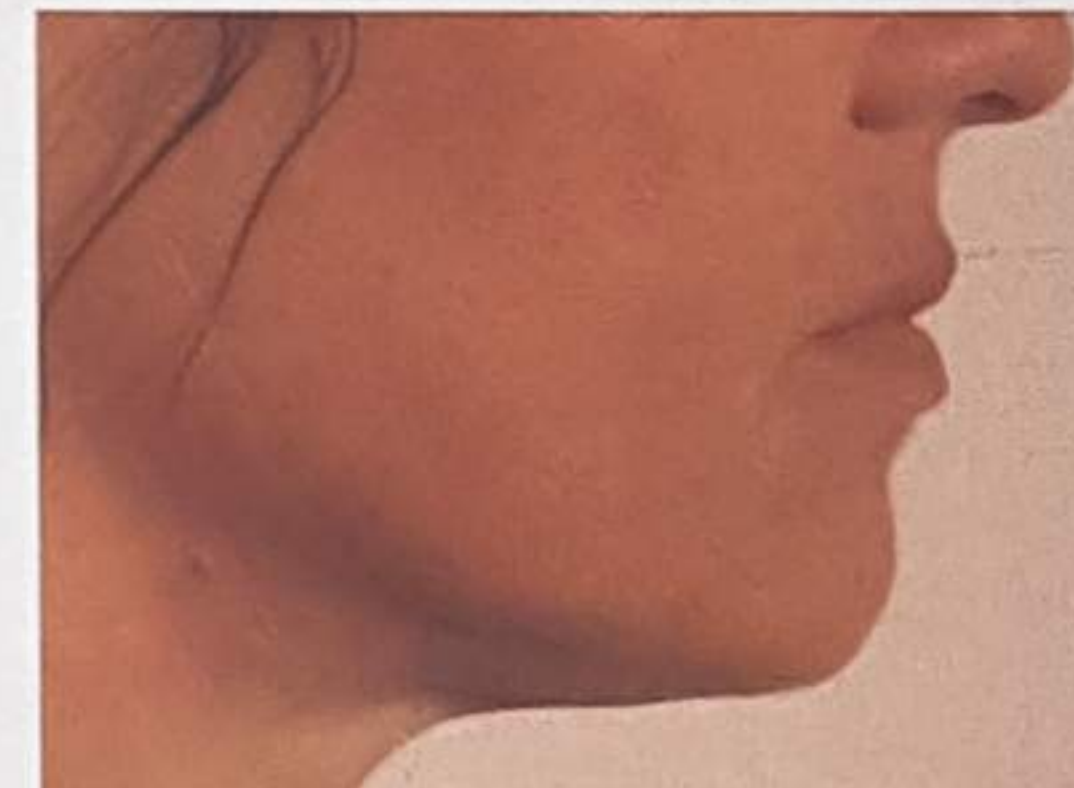
Dopo 8 trattamenti