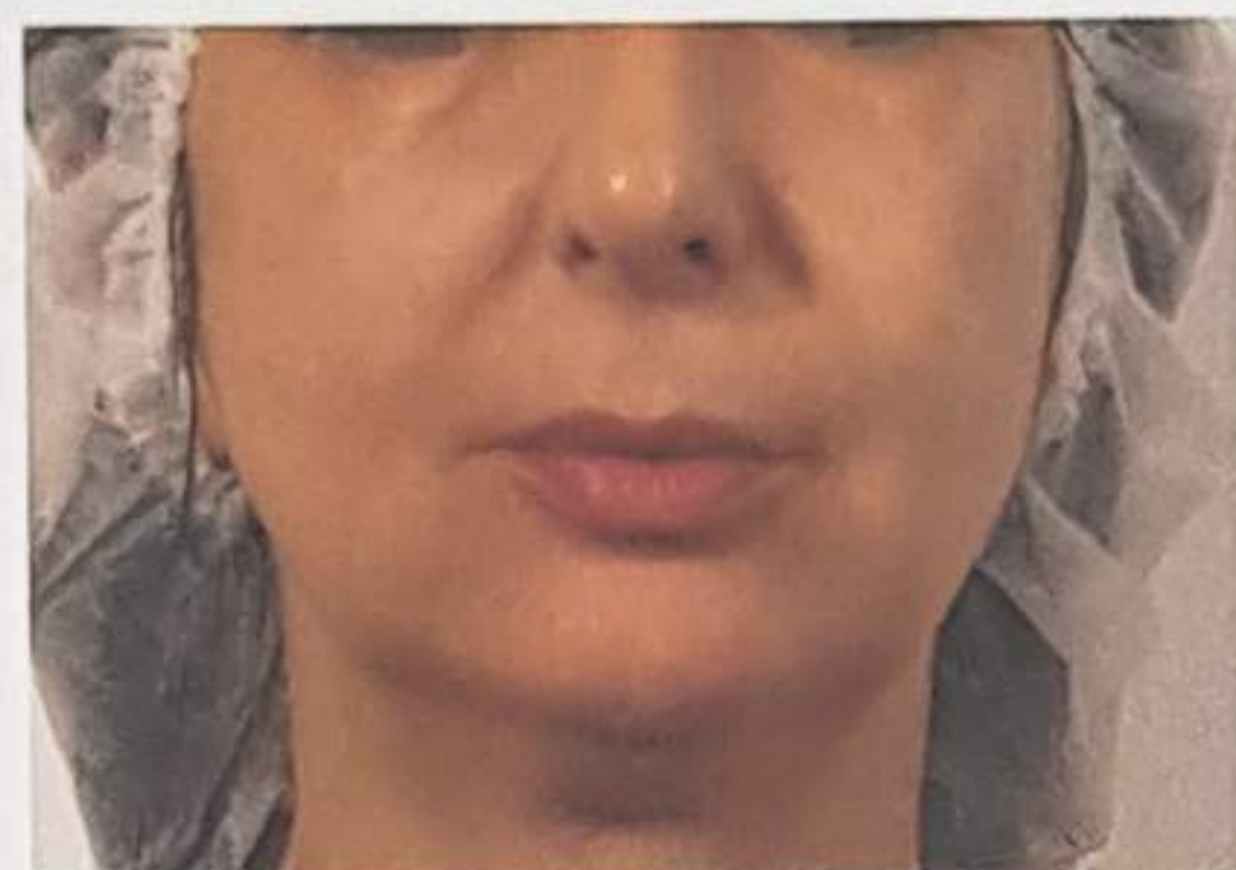
Dopo 5 trattamenti